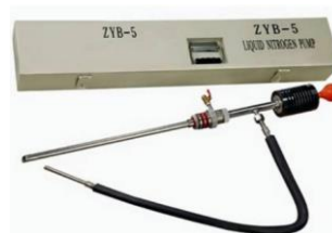
Dispositivo de Descarga ZYB-5

Desenvolvido especialmente para armazenamento de nitrogênio líquido, caracterizado pelo pequeno diâmetro do gargalo e baixa taxa de perda por evaporação estática.