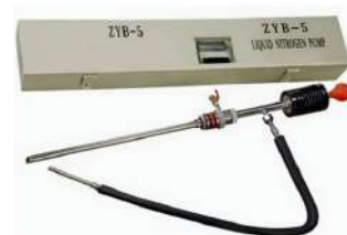
Dispositivo de Descarga ZYB-5

Desenvolvido especialmente para armazenamento de nitrogênio líquido, caracterizado pelo pequeno diâmetro do gargalo e baixa taxa de perda por evaporação estática.